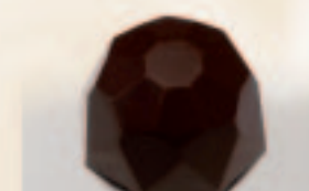
30 Diamant Banaancreme