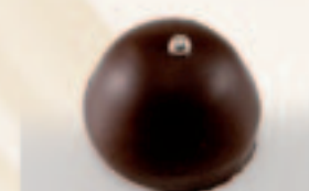
33 Amandine Botercrème van marsepein + Amaretto