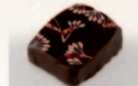
15 Fleur de Sel Caramelganache met Fleur de Sel