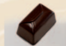
25 Ballotin Rhumslagroom + praliné