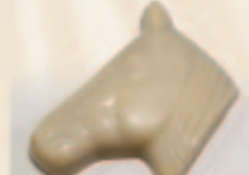
14 Paardekop Praliné