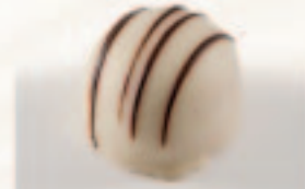
6 Sprits Mokka-vanilleslagroom