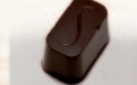
23 S-Fondant Amandelpraliné