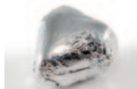
32 Hartje Praliné