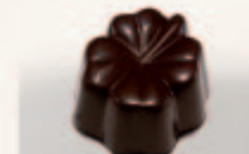
57 Klaverblad F Vanillecrème