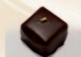
59 Cassini Laagje pate-fruits van cassis met ganache