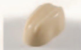
5 Cointreau Cointreauslagroom