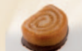
28 Mokka-Suisse Mokkamarsepein