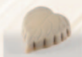
8 Blaasje Praliné + hazelnootstukjes