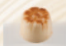
9 Margriet Banaanslagroom