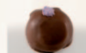
44 Vlinder gepralineerd Grand-Marnierbotercrème