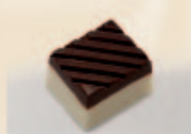
56 Exotique Passievruchten-caramel