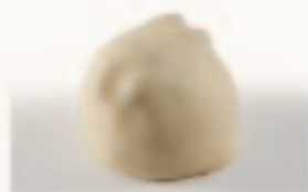
1 Manon Mokka-vanilleslagroom