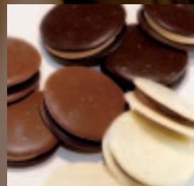
Gentse Kaneeltjes Caramel botercrème met kaneel