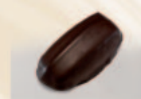
27 Pistachenmarsepein Pistachemarsepein