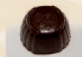
26 Roosje Advocaat