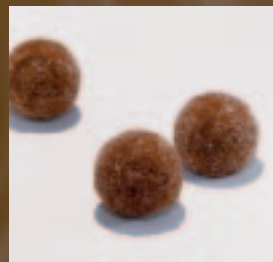
Truffel Koffie Ganache met koffielikeur