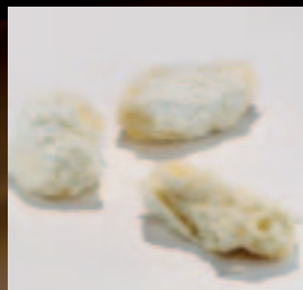
Truffel wit Botercrème met Cointreau