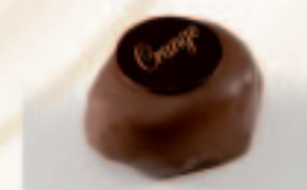
48 Marsepein-Orange Appelsienmarsepein