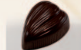
20 Coeur Praliné met bresilienne