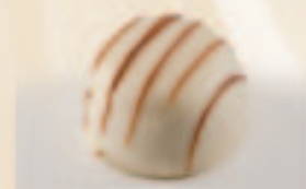
19 Citroen-Délice Citroenganache