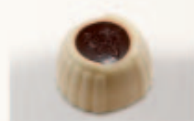
3 Roosje Advocaat