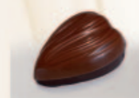
42 Cocos Praliné met gebrande coco's