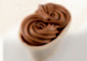
7 Mandje Praliné + gianduja