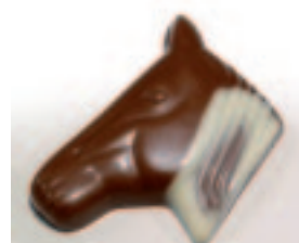
49 Chevaux Donkere ganache