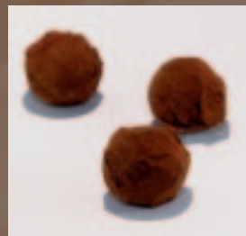
Truffel Baileys Ganache met Baileys