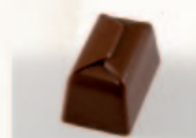
43 Ballotin Chocomousse met caramel