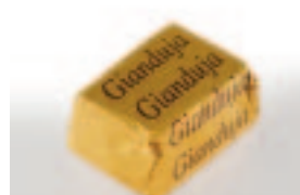
53 Gia Gianduja