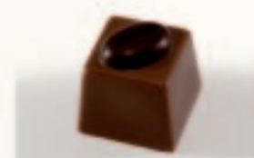
37 Café Koffieganache