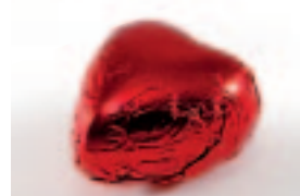
54 Hartje Praliné