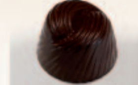
18 Brasil Koffieslagroom