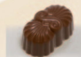
65 Noisette Luxe praliné met gecarameliseerde nootjes