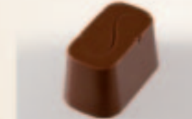
35 S-Melk Praliné met gepofte rijst