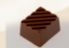
58 Speculoos Amandelpraliné met stukjes speculoos