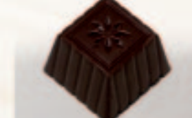
24 Ster Cointreau-Appelsiencaramel