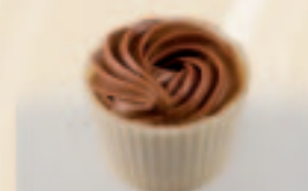
12 Dressée Gianduja