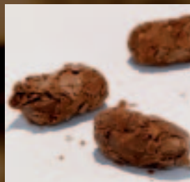
Truffel bruin Botercrème met praliné