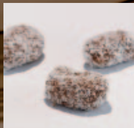
Truffel Cocos Botercrème met Grand-Marnier