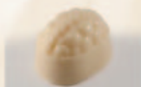
13 Vruchtenmandje Grand-Marnierganache