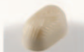
2 Vlecht Witte ganache + kaneelbotercrème