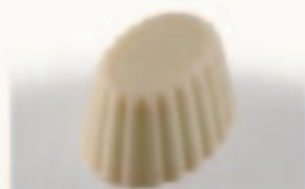
4 Cuvette Pistachecrème