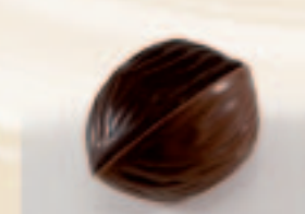
51 Walnoot Praliné