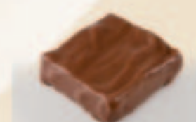
55 Carré feuilleté Praliné met feuilletine