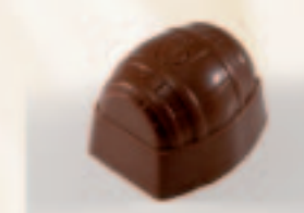
41 Tonnetje Cognacbotercrème