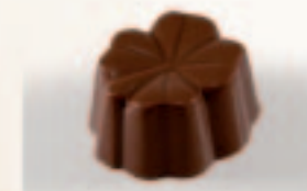
36 Klaverblad Praliné met hazelnoot