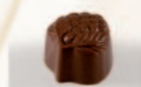
46 Sardbei Aardbeiganache