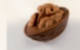
38 Dubbel Noot Praliné met walnoot