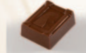
39 Cleo Vanilleslagroom met nootjes