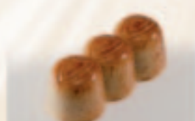
10 Triplo Grand-Marnierbotercrème