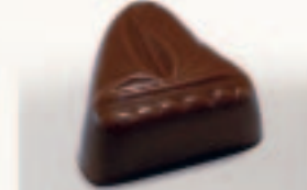
40 Bootje Chocoladebotercrème