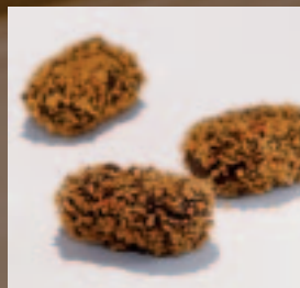
Truffel Amaretto Botercrème met Amaretto