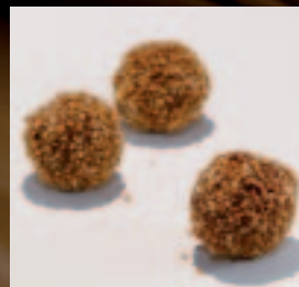
Truffel Champagne Ganache met Champagne