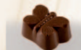
45 Vlinder Nougatcaramel