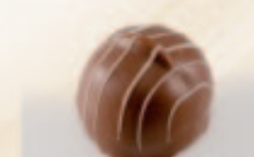
47 Krokant Mokkacreme op laagje nougat