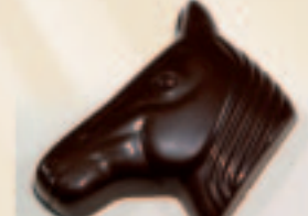
29 Paardekop Praliné