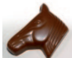
50 Paardekop Praliné