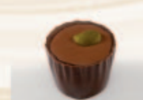
52 Snobinette Toffeebotercrème