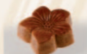
11 Vlooltje Caramel