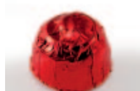
21 Kriek verpakt Likeurcrème met kriek