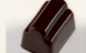
34 Ahambra Appelsiengelei met chocoladeganache