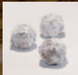
Truffel Advocaat Advocaat