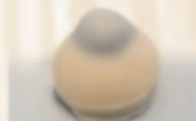
17 Bombe vanille Vanillebotercrème met amarenakers