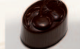
22 Dubbelkers Bosbescrème