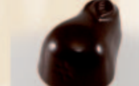
31 Peer Chocolademarsepein